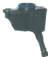
DEFLETOR DE ÓLEO