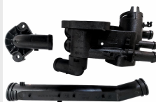
KIT DO CAVALETE DE DISTRIBUIÇÃO DE ÁGUA