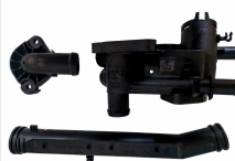
KIT DO CAVALETE DE DISTRIBUIÇÃO DE ÁGUA