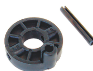
EMBREAGEM DO DISTRIBUIDOR