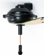
POSICIONADOR PNEUM AR CONDICIONADO