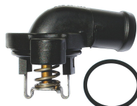
KIT COTOVELO TAMPA E VÁLVULA TERMOSTÁTICA