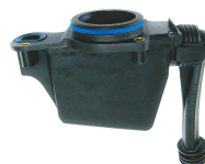
DEFLETOR DE ÓLEO